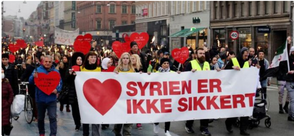
Demonstration in Kopenhagen gegen die Rückführung syrischer Geflüchteter 13. November 2021: „Syrien ist nicht sicher.“

Fortsetzung von: Zweiklassengesellschaft für geflüchtete Menschen in Europa